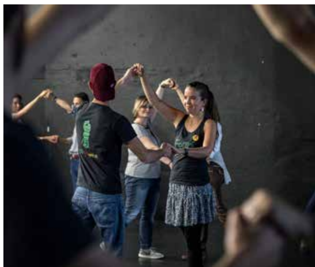
4. Cours