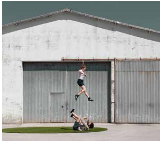
2. L'envers