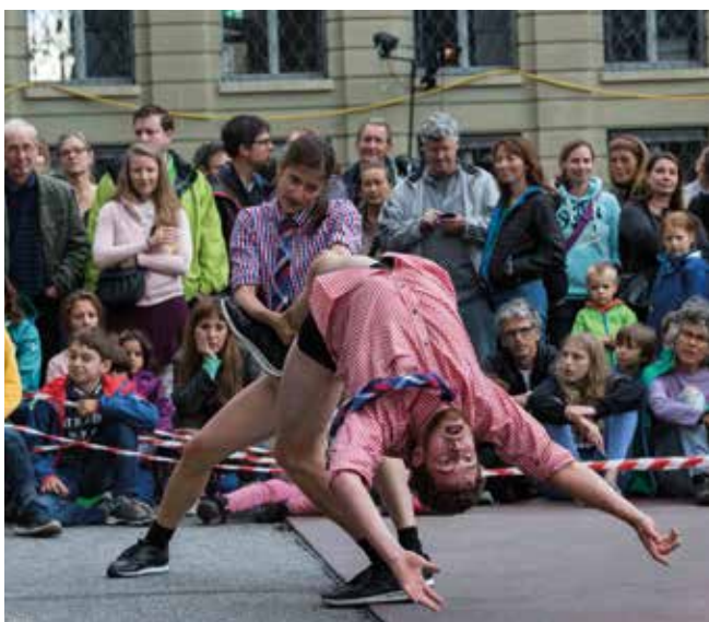
5. Little Joy © Christian Glauz