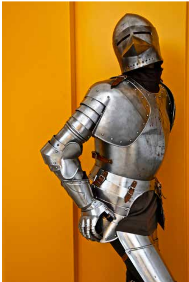
Jukebox Heroes © Delgado Fuchs