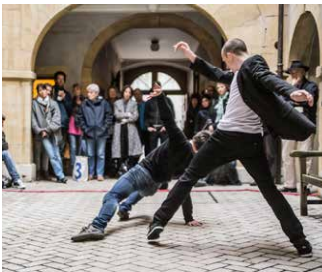
3. EquiLibre © David Rossetti