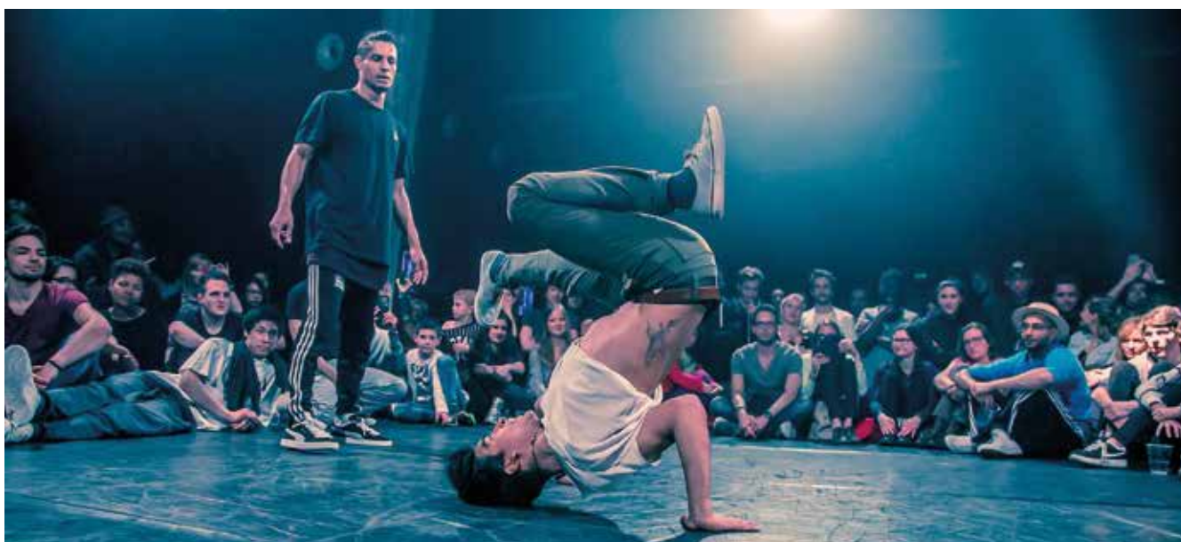
Swiss Battle Tour