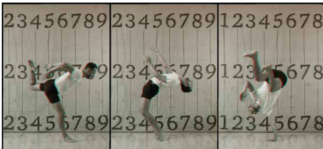
Kiriakos Hadjiioannou