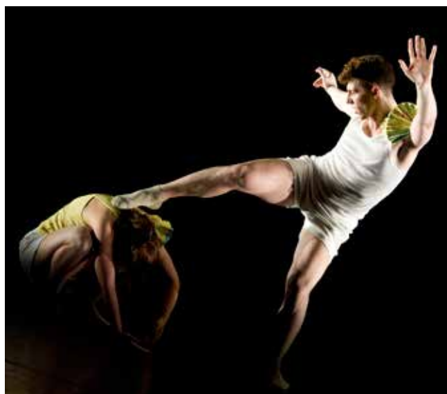
6. Take Off! © Caroline Minjolle