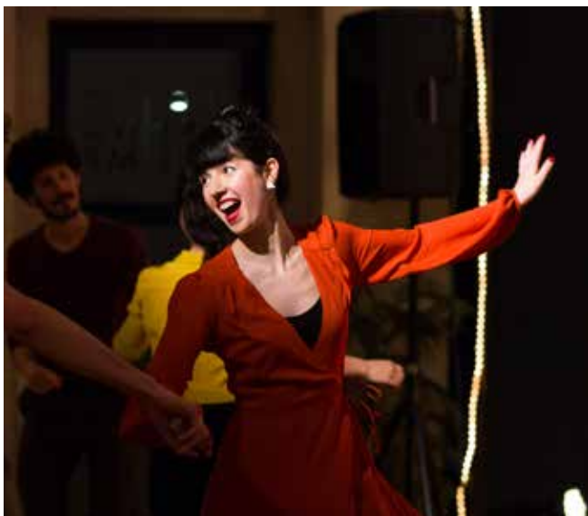
1. Soiree